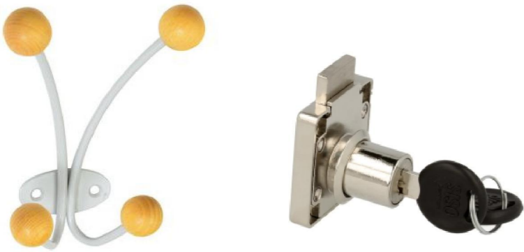
PRZYKŁADOWY WIESZAK I ZAMEK